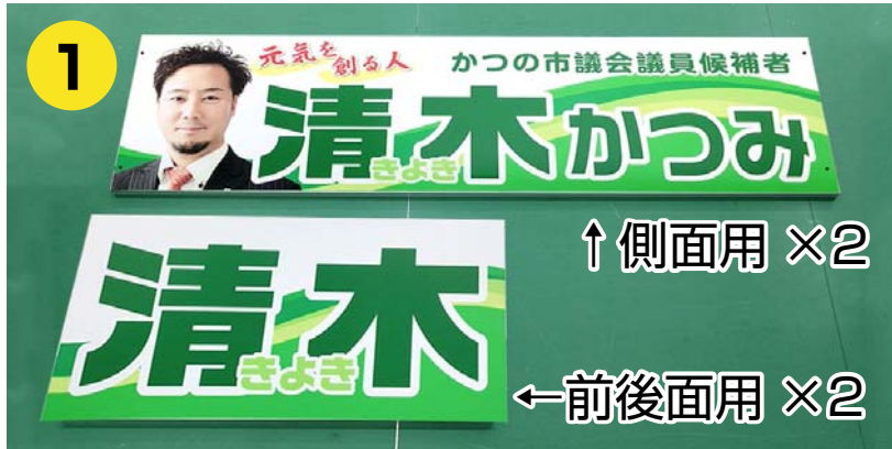
アルミ枠付き看板