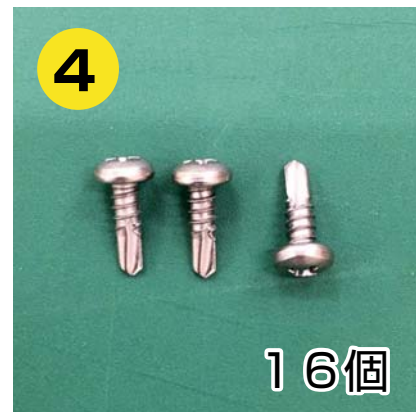
中棧取付用ドリルビス