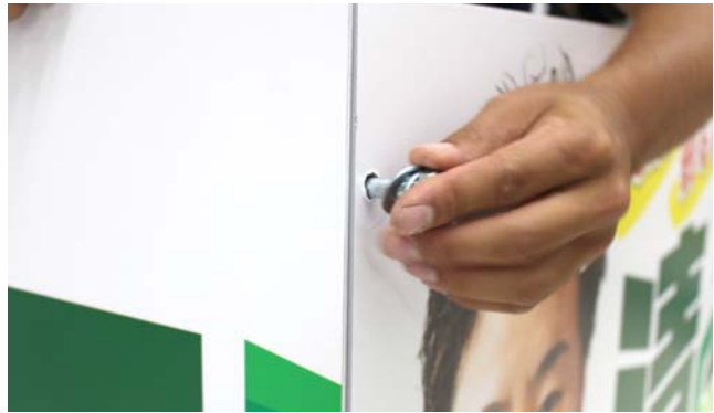
仮穴にボルトを差し込みます。